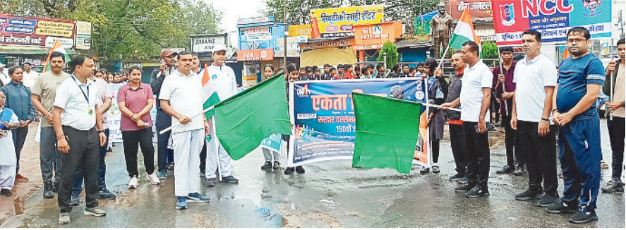
दौड़ में शामिल अधिकारी-कर्मचारी।