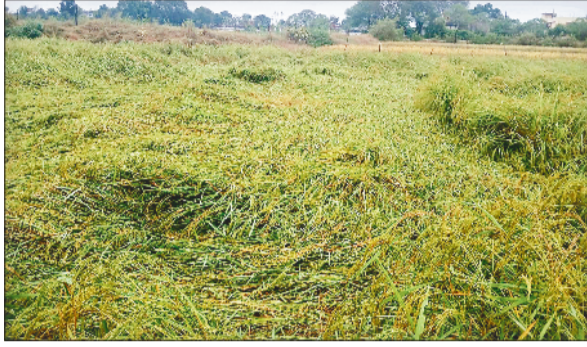
बेमौसम बारिश से खराब हुई फसल।