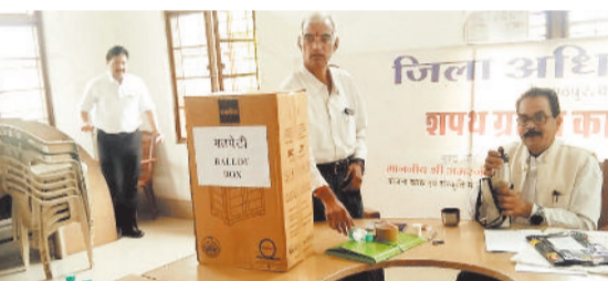
जारी चुनाव प्रक्रिया।

एकता, शांति और सत्य के प्रतीक हैं और उनके प्रति अभद्र भाषा का प्रयोग समाज की धार्मिक भावनाओं का अपमान है। समिति ने प्रशासन से यह भी मांग की है कि सोशल मीडिया पर धार्मिक आधार पर नफरत फैलाने वालों पर सख्त निगरानी रखी जाए तथा साइबर सेल के माध्यम से ऐसी गतिविधियों को रोक जाए।