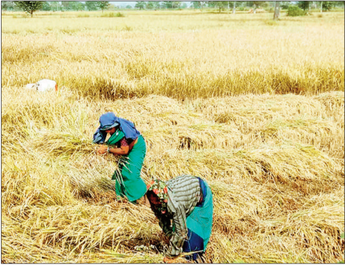
धान काटती महिलाएं।

शासन द्वारा इस बार ठेके पर ग्रामीण क्षेत्र के युवाओं के माध्यम से ऑनलाइन गिरदावरी कराई गई थी। गांव के एंड्रयूट मोबाइल धारक युवकों को एक दिवसीय प्रशिक्षण देकर ऑनलाइन गिरदावरी करने की जिम्मेदारी सौंपी गई थी। 30 सितम्बर तक सॉफ्टवेयर में ऑनलाइन गिरदावरी कराने के बाद पटवारियों के माध्यम से चिन्हित रकबे का भौतिक सत्यापन भी करा इसकी जांच की गई। ऑनलाइन गिरदावरी पूरी होने के बाद दावा आपति मंगाने सभी का निराकरण किया गया। शासन द्वारा 31 अक्टूबर तक किसानों का पंजीयन कराने की तिथि निर्धारित की गई