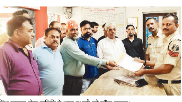
सिंधु समाज सेवा समिति ने थाना प्रभारी को सौंपा ज्ञापन।